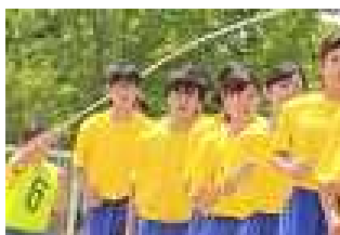
＜大縄とび＞ 学年が上がる毎に難易度が高くなる種目、心一つに跳ぶ3年生の姿

を通して、自分や仲間のことを深く考える機会となりました。体育祭の様子は、学級通信などで詳しい様子を紹介していますが、子どもたちの姿をご覧いただき、今後、懇談会や学校評価等で感想をいただくと幸いです。