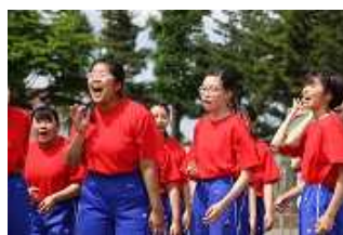
＜力強い応援＞ 全力で仲間を励ましている様子

「 頑張ることは格好いい 」「 心を一気に揃えることは素敵なこと 」を体現し、チームのために仲間と流す汗、こぼれる笑顔は、眩しく、キラキラと輝いていました。一人一人が役割を果たそうと努力し、励まし合い、力を合