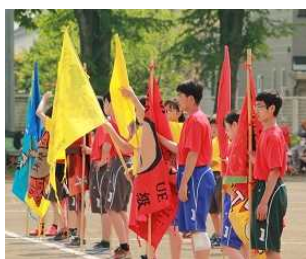
＜開会式＞ 学級旗を掲げ、「選手宣誓」を行う様子

5月27日、「それいけ！緑園魂 ～Rise to the top～」のテーマのもと、第32回体育祭を実施しました。コロナ禍を経て、改めて大切にしたい「密」な関わりを、4年ぶりに行うことができました。開催に伴い、PTAの皆様