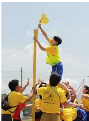
＜女王君臨＞ 3年女子、力を合わせ旗を立てる様子